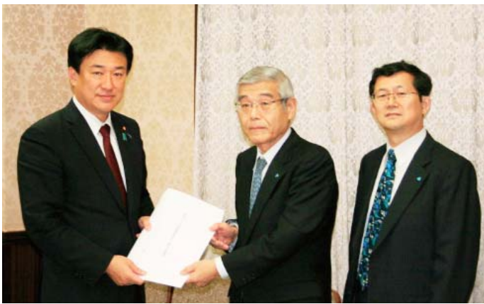
左から 木原財務副大臣、柳田税制委員長、横山専務理事