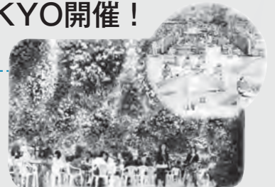
井の頭恩賜公園会場予想図

「緑の風がふきぬける東京」をテーマに、「第29回 全国都市緑化フェアTOKYO」が開催されます。平成24年9月29日(土)から10月28日(日)まで、東京都内6カ所の上野恩賜公園・井の頭恩賜公園・日比谷公園・浜離宮恩賜庭園・海の森・国営昭和記念公園がメイン会場となって、さまざまなイベントが行われます。まちにあふれる緑と花を楽しみに、ぜひお出かけください!