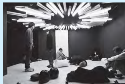
モナカ興業#10『43』

【問い合わせ】公益財団法人 三鷹市芸術文化振興財団 TEL:0422-47-5122