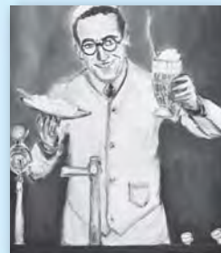
ハロルド・ロイド(ソーダ・ジャック) 2012年 50.3×40.7cm