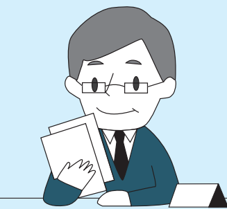
税理士がお答えします