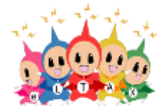
eLTAX イメージキャラクター エルレンジャー